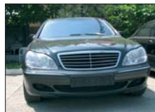
MERCEDES S430 4matic 2003, full option, TV tuner, 48.000 km, 45.000 Euro DDP