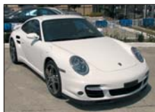
PORSCHE 911 Turbo 997 Biturbo, 0km, 2006, nou- nout, full option 160.000 Euro CIP