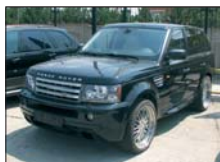
RANGE ROVER Supercharged 2006, 8.000 km, full option, Styling ARDEN 80.000 Euro+TVA