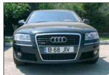
AUDI A8 4.0 TDI 2004, 38.000 km, full option Predare leasing - avans 26.000 Euro