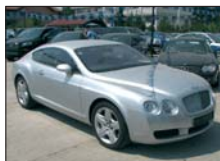
BENTLEY Continental GT 2004, 24.000 km, full option, piele roșie 160.000 Euro inclusiv TVA