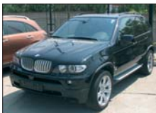
BMW X5 4.8 IS 374 CP, 2004, 62.000 km, full option 67.000 Euro DDP