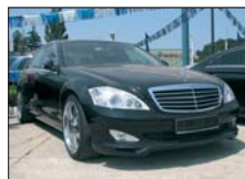
MERCEDES S Klasse S350 Long, 16.800 km, decembrie 2005 89.500 Euro DDP