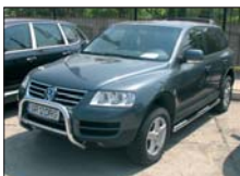
VOLKSWAGEN Touareg 2,5 TDI, 2005, 54.000 km, full option, cutie manuală 42.000 Euro DDP discutabil