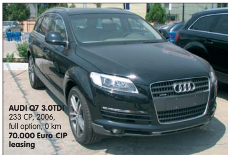
AUDI Q7 3.0TDI 233 CP, 2006, full option, 0 km 70.000 Euro CIP leasing