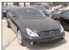
MERCEDES CLS 500 decembrie 2004, 306 CP, 34.000 km, full option, AMG styling 68.000 Euro inclusiv TVA