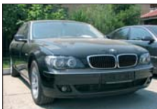
BMW 730 D Long 218 CP, octombrie 2005, 18.000 km, full option, piele bej, 2 x TV Tuner 60.000 Euro DDP