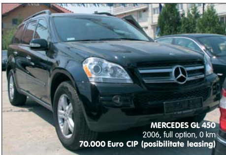
MERCEDES GL 450 2006, full option, 0 km 70.000 Euro CIP (posibilitate leasing)