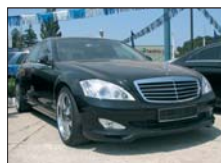
MERCEDES S Klasse S350 Long, 16.800 km, decembrie 2005 89.500 Euro DDP