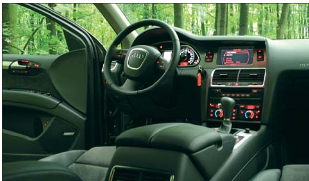
Calitatea materialelor folosite la Q7 este net superioară față de Touareg

Un alt aspect despre care vreau să vorbim este calitatea materialelor interioare. Ambele modele au dispus de unele dintre cele mai bune finisări posibile. Cu toate acestea, Q7 iese învingător ▶