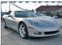
CORVETTE 2006, full extra, 5.000km 67.000 Euro