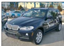
BMW X5 model 2007 2007, 0 km, full option 100.000 Euro CIP