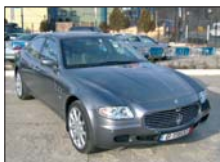
MASERATI 2006, full extra, 8.000km posibilitate leasing