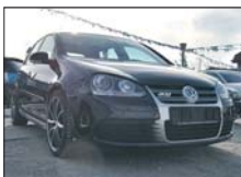
VW GOLF 5 R32 2006, full extra, 19.000km 36.000 Euro