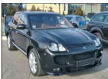
PORSCHE Cayenne 2003, 45.000 km, full extra, pachet Hamman 80.000 Euro