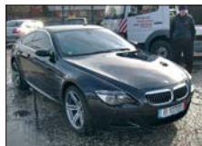
BMW M6 2006, full option posibilitate leasing