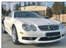
MERCEDES SL 55 AMG 2003, full option, 42.000km 90.000 Euro CIP