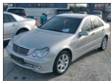
MERCEDES C200 CDI 2004, full option, manual, 62.000km 20.000 Euro