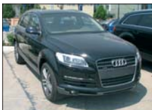
AUDI Q7 3.0TDI 233 CP, 2006, full option, 0 km 66.000 Euro CIP leasing