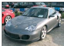
PORSCHE 911 TURBO 2003, 38.700 km, manual, 480 CP 78.000 Euro DDP