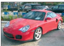
PORSCHE 911 TURBO 2003, 33.900 km, automatic, full option 79.900 Euro DDP