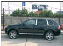
PORSCHE Cayenne Turbo 2004, 58.800 km, full option 68.400 Euro DDP