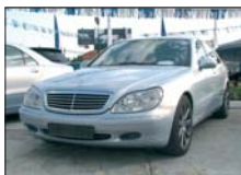
MERCEDES S320 CDI 2001, 41.000 km, full option 40.000 Euro DDP