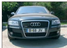
AUDI A8 4.0 TDI 2004, 38.000 km, full option Prezare leasing - avans 26.000 Euro