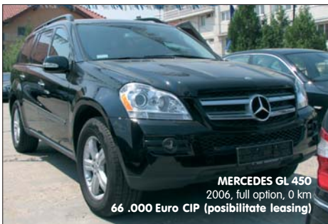
MERCEDES GL 450 2006, full option, 0 km 66 .000 Euro CIP (posibilitate leasing)