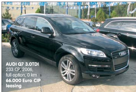
AUDI Q7 3.0TDI 233 CP, 2006, full option, 0 km 66.000 Euro CIP leasing