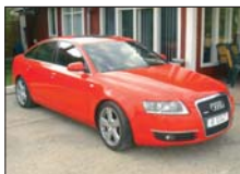
AUDI A6 3.0TDI quattro 2005, automatic, S-Line, 115.000 km 36.000 Euro DDP