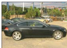
BMW 645 coupe 2003 dec., 31.800km, full option 51.500 Euro DDP