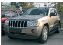
JEEP Grand Cherokee 2005, 59.950 km, full option 39.000 Euro+TVA