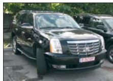
CADILLAC Escalade 2006, V8, 6.000cm 3 , 1.700km 69.900 Euro CIP